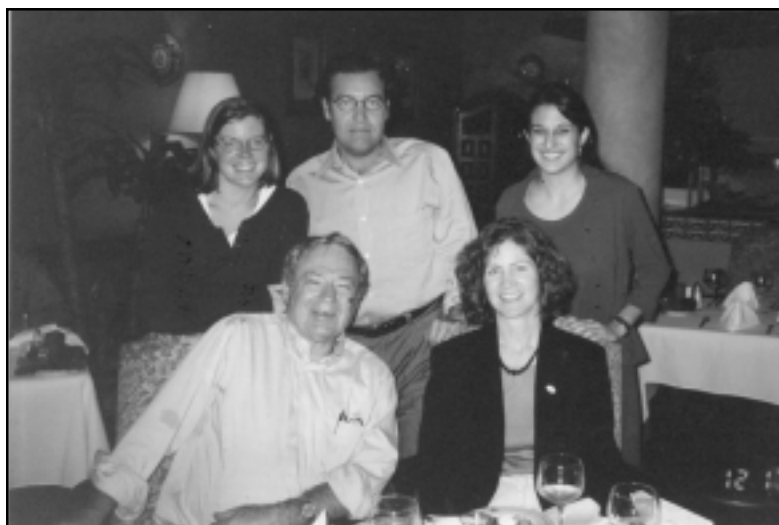
THE CARTER CENTER