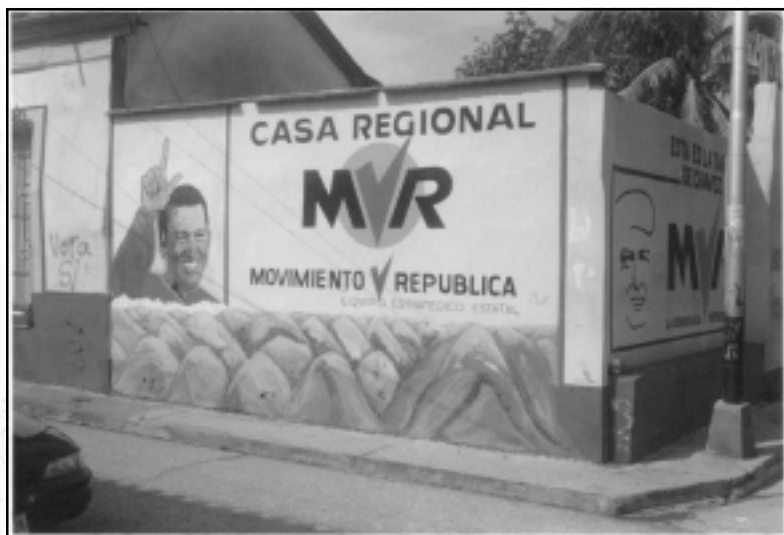
El Movimiento Quinta República (MVR) de Chávez y los candidatos de alianza ganaron 93% de los escaños en la asamblea constituyente.

uso extendido de la “chuleta” 6 , así como la dispersión del voto de la oposición explican en conjunto la abrumadora mayoría de “Chavistas” en la Asamblea Constitucional. El Polo Patriótico logró coordinar el voto mediante la distribución de la “chuleta”, una lista de los candidatos Chavistas; la función de dicha lista era asistir a los votantes el día de la elección. Los candidatos de la oposición, al no querer identificarse con etiquetas partidarias, no pudieron repartir “chuletas” similares entre los votantes. Solamente ciertos gobernadores de la oposición decidieron apoyar a algunos candidatos independientes repartiendo sus “chuletas” a escala regional. El efecto político de la “chuleta” explica la consecuencia indeseada de un sistema electoral que aunque intentaba personalizar el voto, solamente logró motivar la creación de listas electorales para cada partido.