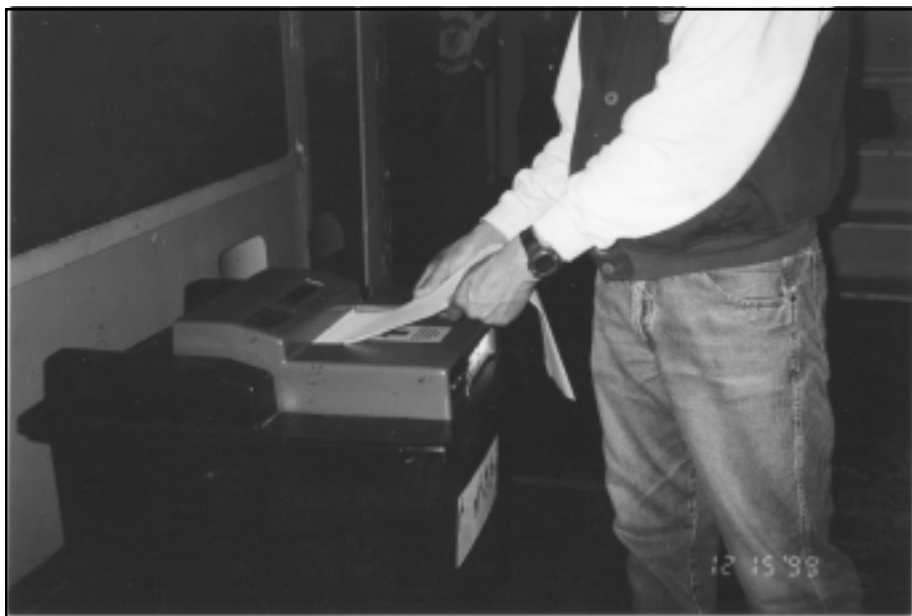
Una máquina automatizada de votación utilizada en Venezuela desde 1998.

Las máquinas tabuladoras de votos están diseñadas para leer las boletas a medida que éstas van siendo ingresadas en las urnas de manera tal que llevan un registro de la cantidad de votos emitidos, los cuales son a su vez asentados en una tarjeta de memoria PCMCIA, conocida como “flashcard”. Esta tarjeta está programada para leer solamente las boletas correspondientes a ese centro de votación específico.