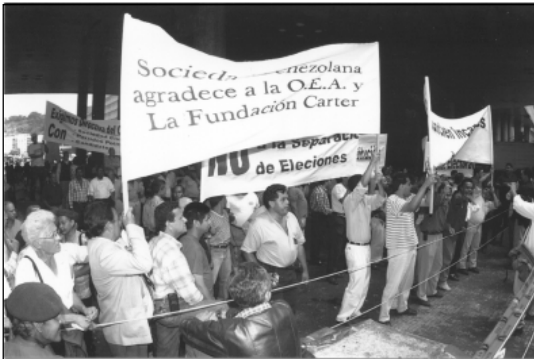
Una multitud de gente reúne afuera del CNE ondeando una bandera dando gracias al Centro Carter.

El 25 de mayo, justo tres días antes de la fecha programada para las “mega-elecciones”, la Corte Suprema dictaminó posponer la elección y suspender todas las campañas electorales. En su fallo, los magistrados encontraron que las condiciones técnicas para asegurar la confianza y la transparencia de las elecciones no existían y que no se había suministrado información suficiente al electorado en cuanto a los candidatos y al proceso correcto para emitir el voto. Las “mega-elecciones” pasaron ahora a denominarse las elecciones del mega-fracaso.