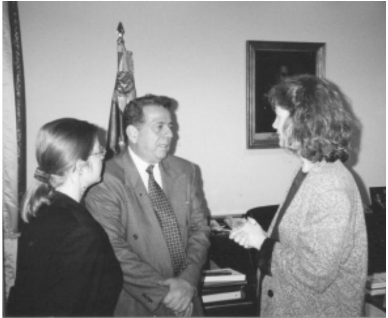
THE CARTER CENTER